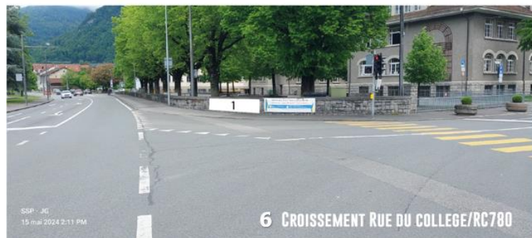
6 CROISEMENT RUE DU COLLEGE/RC780