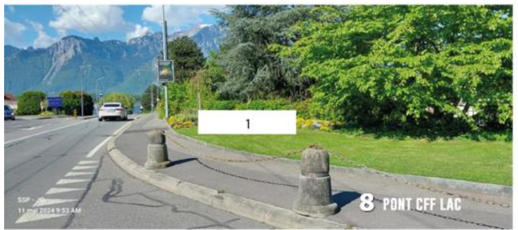
8 PONT CFF LAC