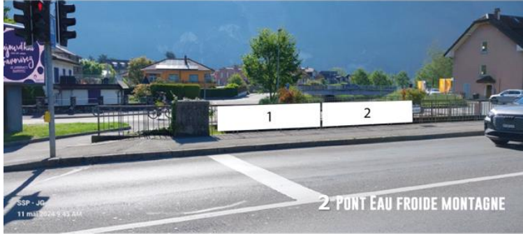
2 PONT EAU FROIDE MONTAGNE