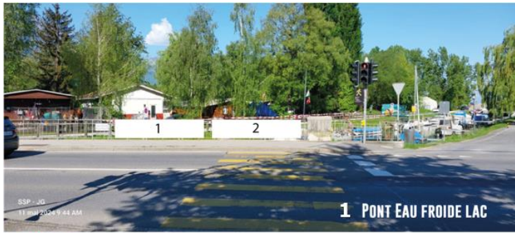
1 PONT EAU FROIDE LAC