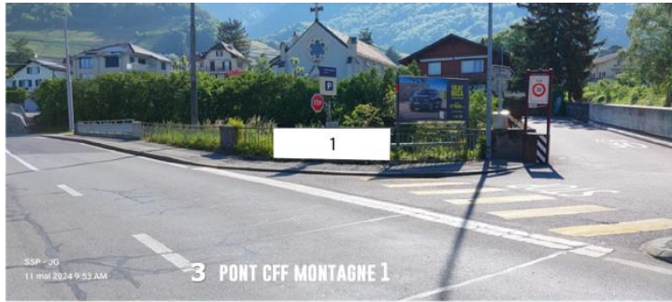
3 PONT CFF MONTAGNE 1