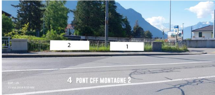
4 PONT CFF MONTAGNE 2