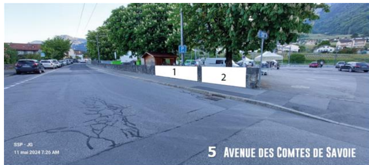
5 AVENUE DES COMTES DE SAVOIE