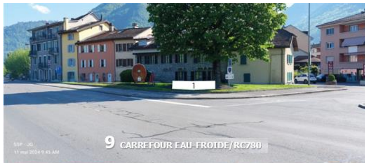
9 CARREFOUR EAU-FROIDE/RC780